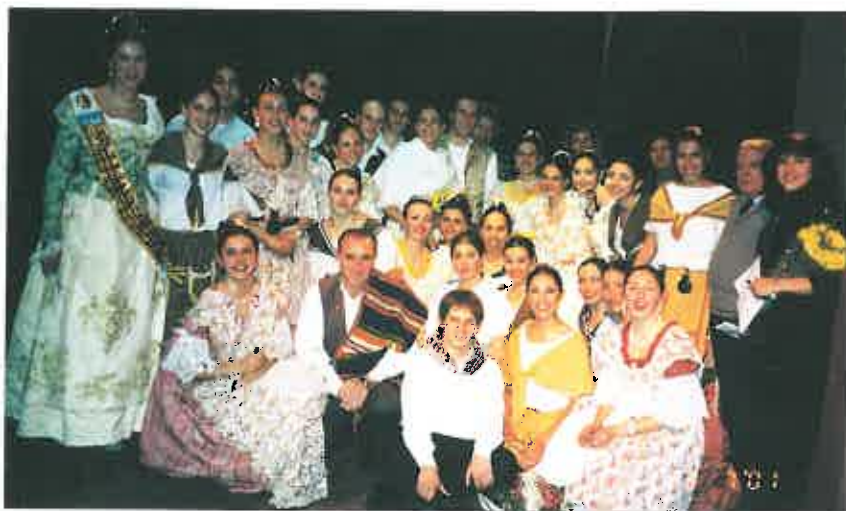
Festival Fi de Curs (Mendoza).

un ampli conjunt de coneixements respecte a dansa, música, costums, indumentària, gastronomia, etc., a la vegada que s'explicava com, perquè i on s'interpretava. Complementàriament, és va contribuir a dotar als centres valencians de distint material didàctic i audiovisual que poguera servir de