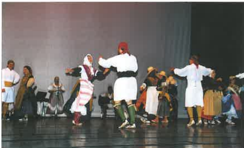
Actuación en el Centro Cultural de Taipei-Shien.