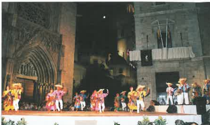
Plaza de la Virgen de Valencia. Ballet de Cuba.

muchos años, para engrandecer, difundir y revitalizar la cultura tradicional valenciana.