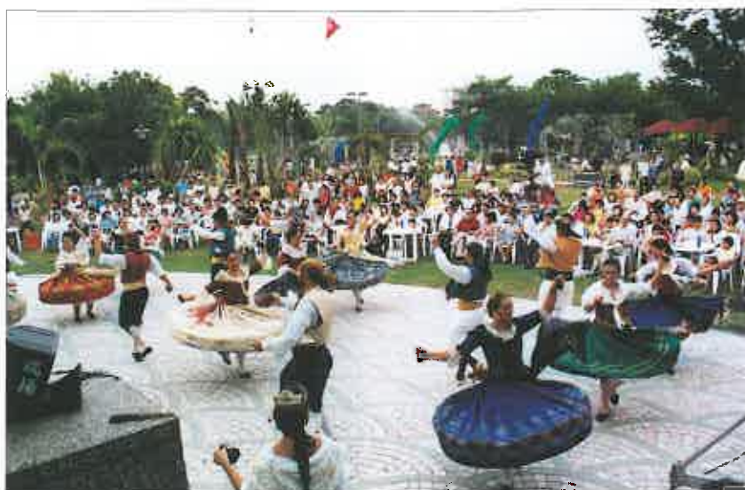
Actuación en el Centro Cultural de Tainan-Shien.

El primer punto de contacto artístico en suelo taiwanés fue en el Festival Internacional de I-Lan en su quinta edición consecutiva y en el que es la primera vez que un grupo español actúa. Representando la cultura y tradiciones de nuestra tierra a miles de ciudadanos chinos que, compartieron sus costumbres con otros cientos de personas de otros 25 países que