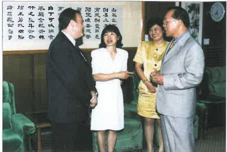
Recepción oficial con el Alcalde de Waoshiung.

El siguiente destino intermedio fue la gran capital, Tai-Pei. Allí se aprovecho la mañana para visitar el Museo Nacional de Taiwan. Por la tarde el grupo actuó en el Centro Cultural de la ciudad donde con el mismo éxito que en días anteriores, también tuvo lugar el protocolario intercambio de regalos. Esa misma tarde, el Presidente de la F.F.C.V. fue recibido por el Director del Centro Cultural y horas después por el Ministerio de Cultura del Gobierno Taiwanés. Al día siguiente se emprendía un nuevo viaje de autobús dirección Tainan, a unos 350 km. al suroeste de la isla. En