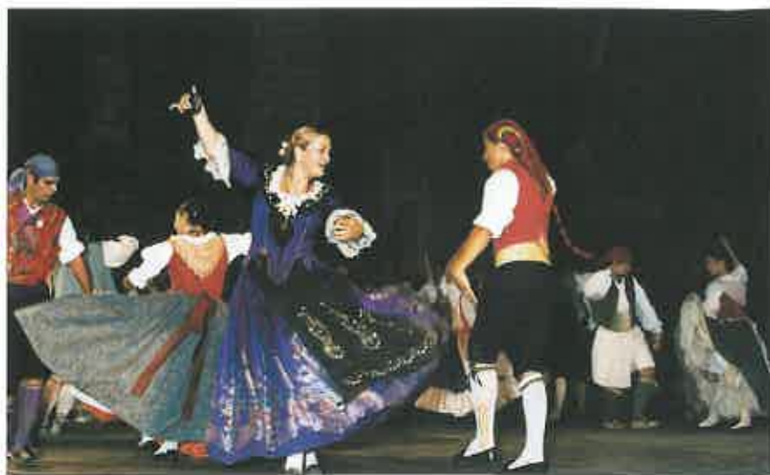
Plaza de la Virgen de Valencia. Grupo de la F.F.C.V.

detalle que el público les agradeció por su buena voluntad.