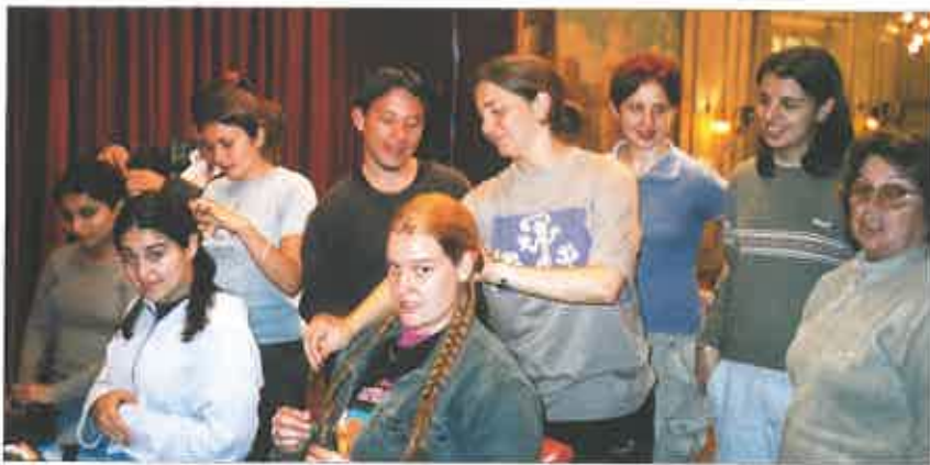
Classe de Pentinat (Buenos Aires).