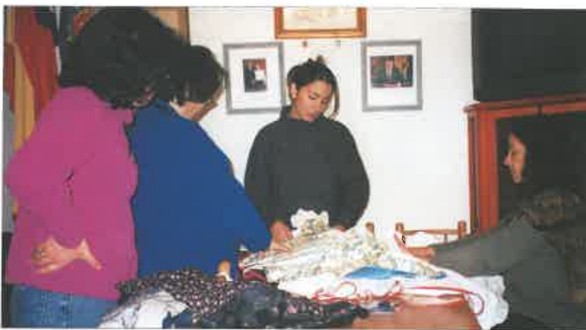
Classe d'indumentària (Santiago de Xile).