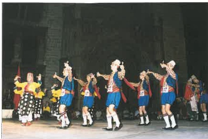
Plaza de la Virgen de Valencia. Turquía.