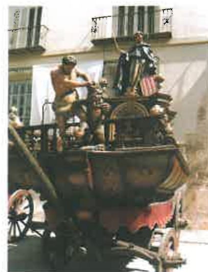
Roca "San Vicente Ferrer".