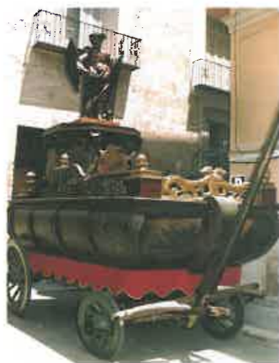
Roca "La Diablera".

Las Rocas se guardan durante el año en su propia casa, la popular "Casa de les Roques", cuya construcción comenzó en 1435 y que está ubicada muy cerca del viejo cauce del Turia y, como dice graciosamente el Sr. Rey de Arteaga, ha sido víctima propiciatoria de todas y cada una de las riadas que a lo largo de la historia ha padecido la ciudad.