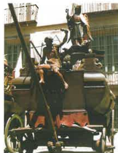
Roca "San Miguel".

Las Rocas, durante todo el año se guardan en su propia casa, "La Casa de les Roques" donde vivía en un principio su Capellá. Su construcción se comenzó el 8 de julio de 1435 y su arquitectura tiene unas características especiales para poder albergar las dimensiones de las mismas, a pesar de que cuando se tendieron los cables eléctricos para el trolley de los tranvías, en el primer tercio del siglo XX, tuvieron que acomodar la altura de las Rocas para que pudieran pasar por debajo.