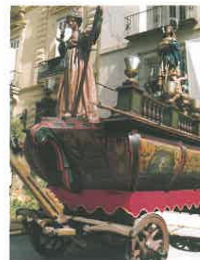
Roca "La Purísima".

Once son las Rocas existentes hoy, cada una con su interesantísima historia particular. Resumiendo al máximo las enumeraremos así: