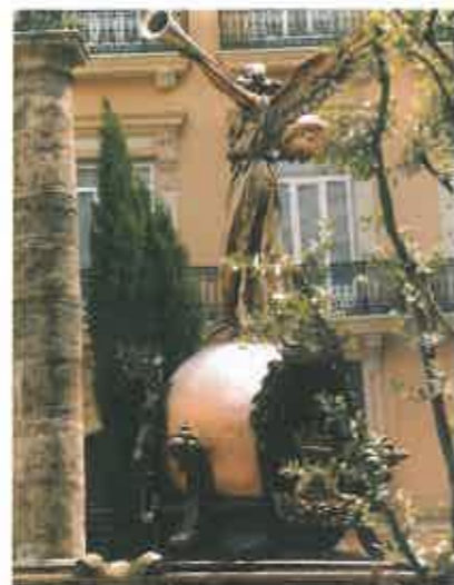
Roca "La Fama".