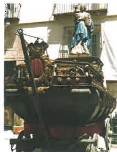
Roca "La Fe".