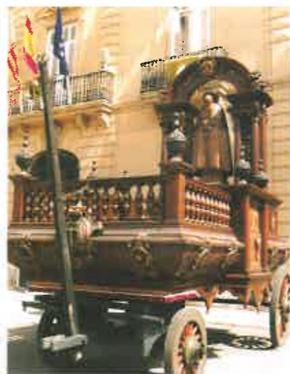
Roca "Del Patriarca".

Las fuentes literarias y el material gráfico nos ha sido facilitado por el Ayuntamiento de Valencia.