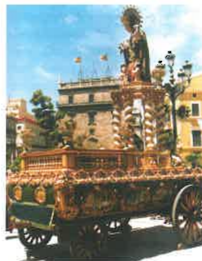
Roca "Mare de Deu dels Desamparats".