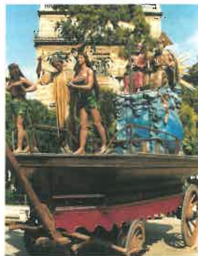
Roca "La Santísima Trinidad".