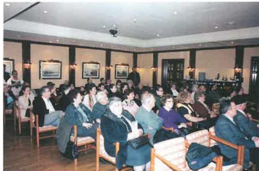
Público asistente al acto.

El cierre de estas intensas Jornadas sobre nuestro Patrimonio Inmaterial se realizó con una mesa redonda que tenía como tema "Las Tradiciones y los Medios de Comunicación".