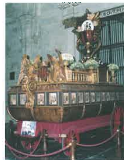
Roca "Santo Cáliz".