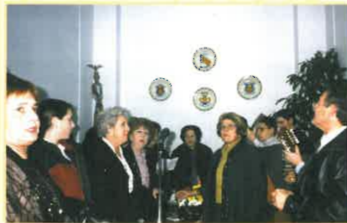
Actuación del cor popular de Lo Rat Penat en el local de la F.F.C.V., durante el día de la inauguración