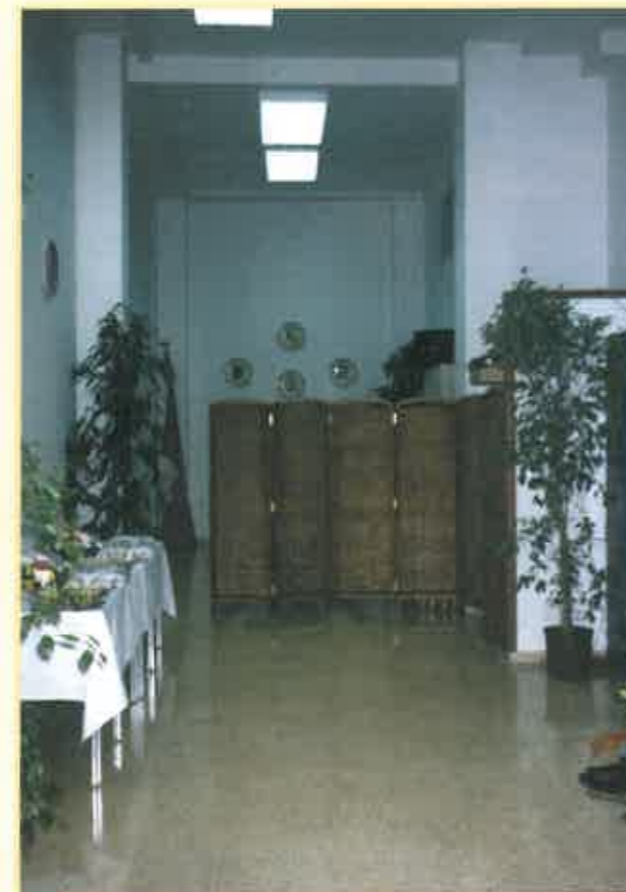
Vista general del local de la F.F.C.V. y zona donde está ubicada la biblioteca, la cual cuenta en la actualidad con cerca de 2.000 volúmenes, aportados por la Generalidad Valenciana, Diputación y Ayuntamiento de Valencia